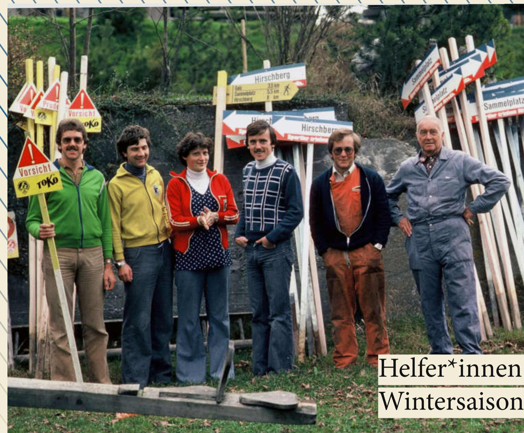
Helfer*innen verteilen für die Wintersaison die Markierungstafeln