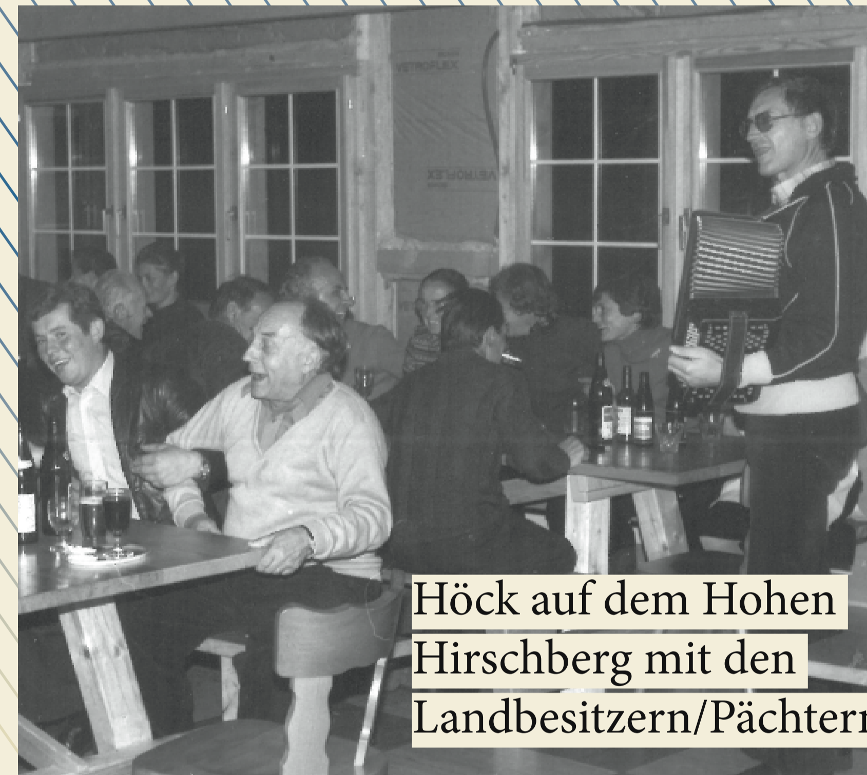
Höck auf dem Hohen Hirschberg mit den Landbesitzern/Pächtern