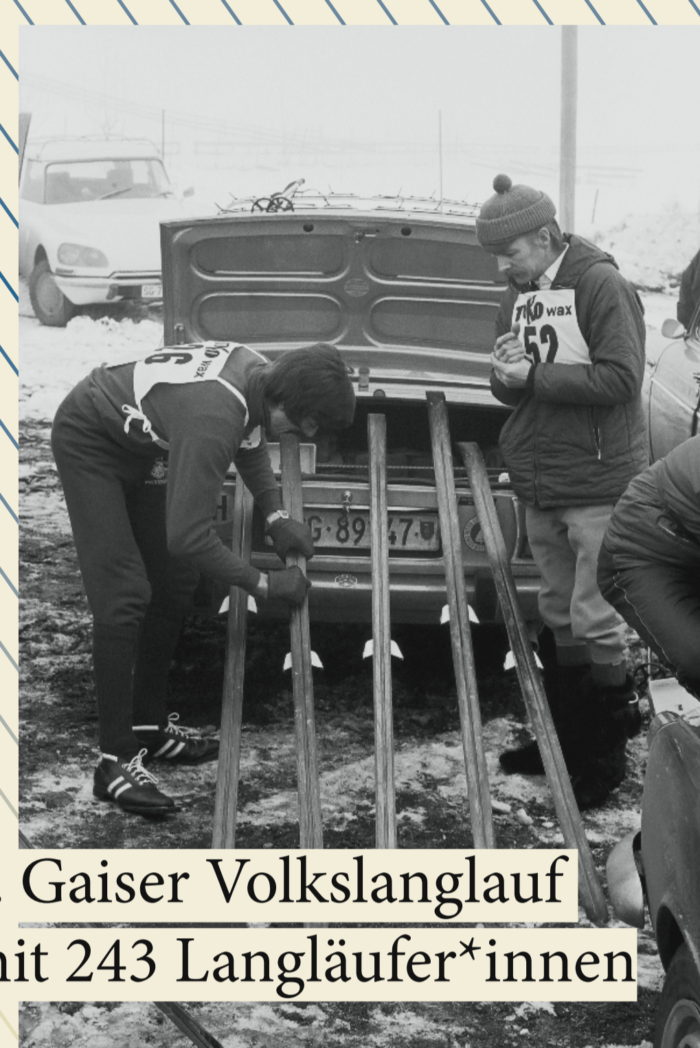
1. Gaiser Volkslanglauf mit 243 Langläufer*innen