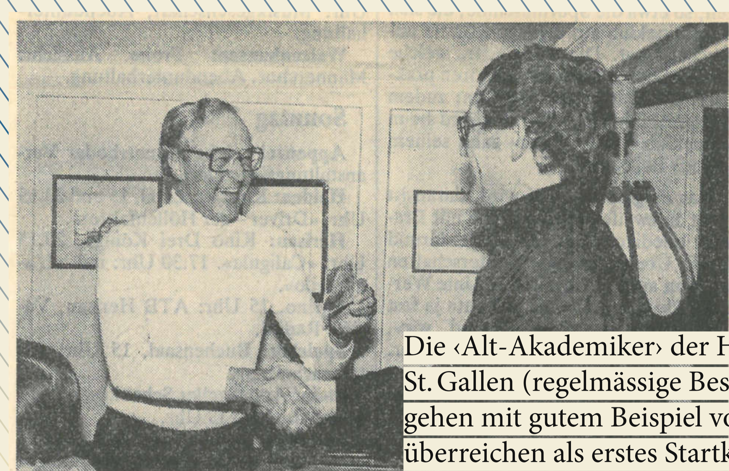
Die «Alt-Akademiker» der Hochschule St. Gallen (regelmässige Besucher seit Jahren) gehen mit gutem Beispiel voran und überreichen als erstes Startkapital eine Spende von CHF 1'000.- zu Gunsten eines neuen Loipenfahrzeugs