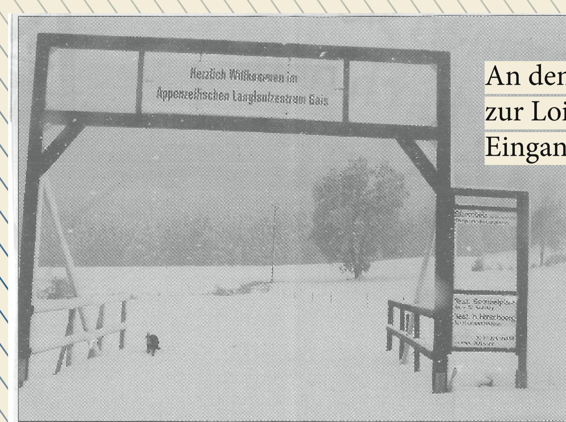
An den Ausgangspunkten zur Loipe werden zwei Eingangstore erstellt

Am letzten Wochenende lag schon einmal über 20 cm Schnee. Da dieser genau einen Monat früher als vor einem Jahr fiel – als die Langlaufloipen am 17. November begannen – war es unvorstellbar, dass er auch länger blieb. Trotzdem mussten am letzten Samstag und Sonntag etliche Strassen erstmals in diesem Winter, bzw. Herbst geräumt werden, und einige Kinder waren beim Sonntagspaziergang mit ihrem Eltern schon mit dem Schlitten unterwegs.