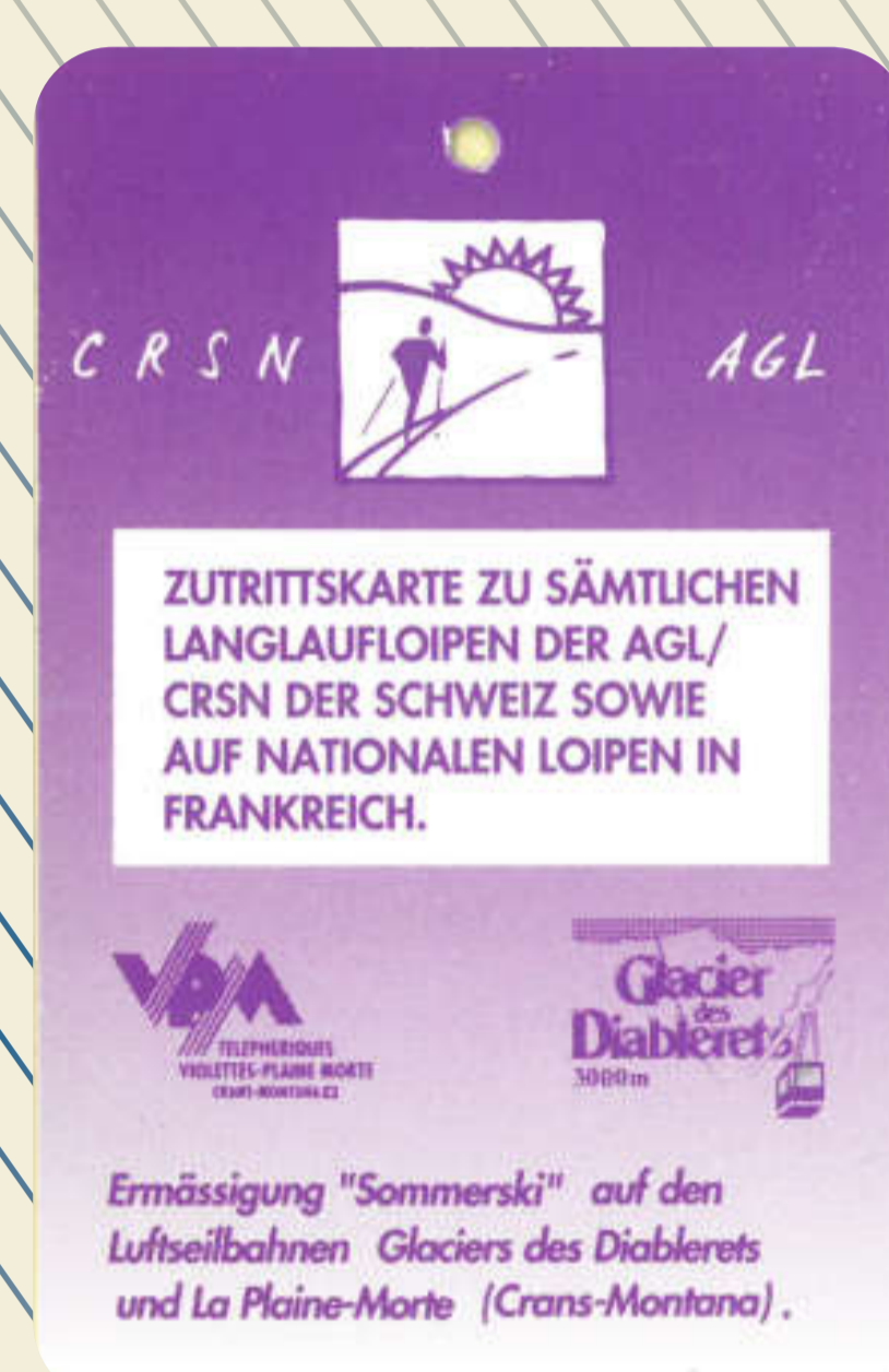
Der Loipenpass berechtigt den Langläufer, alle offiziellen Loipen in der Schweiz zu nutzen