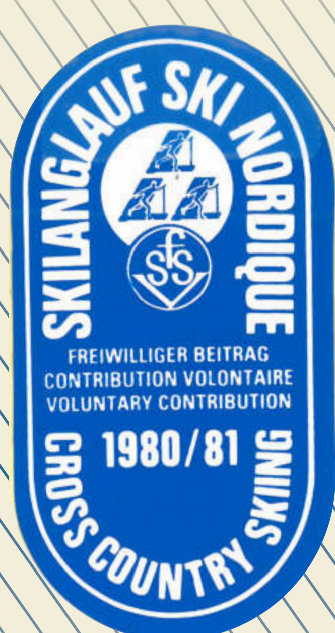
Vom freiwilligen Beitrag zum Loipenpass