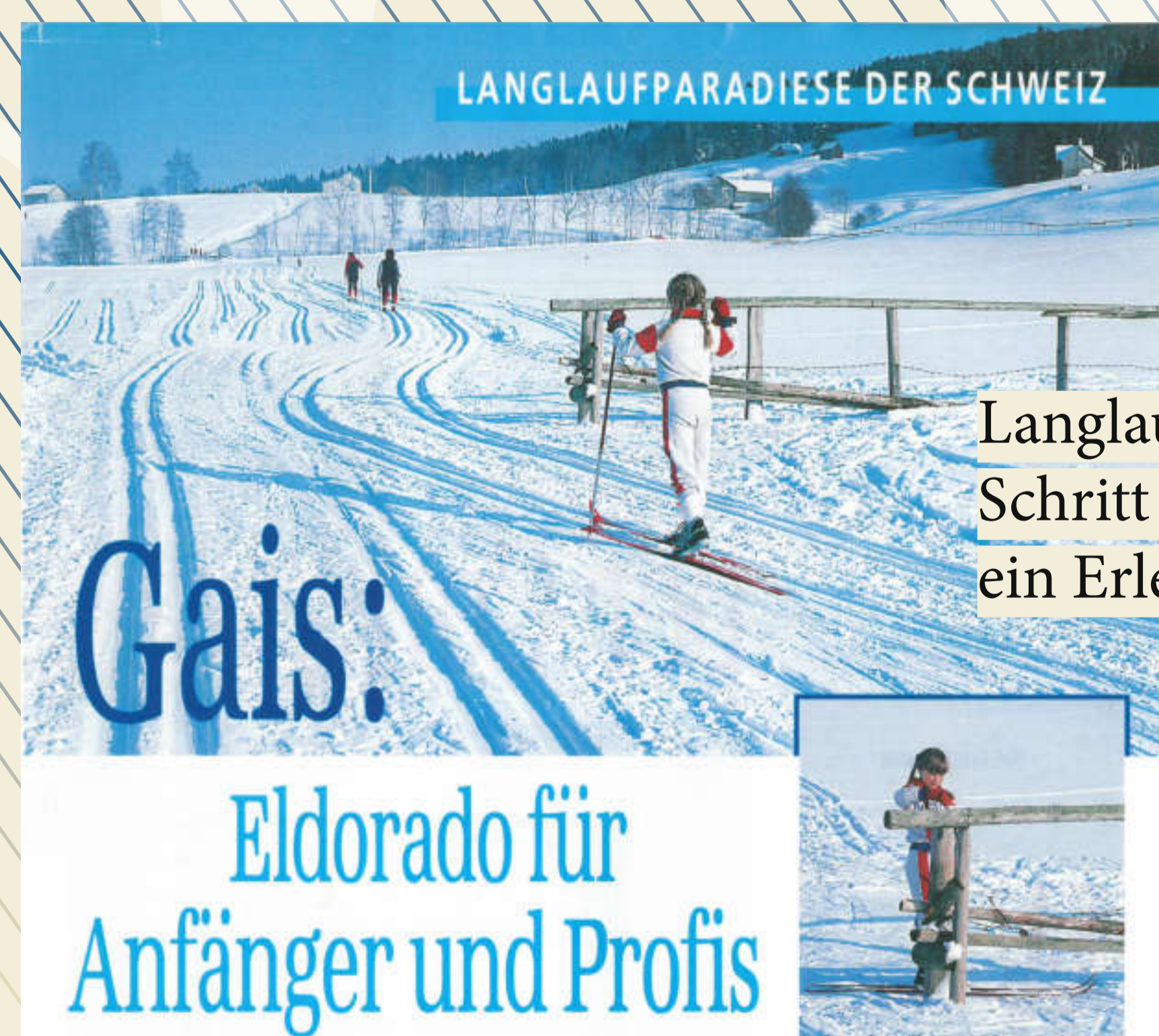
Langlaufen in Gais ... Schritt um Schritt ein Erlebnis