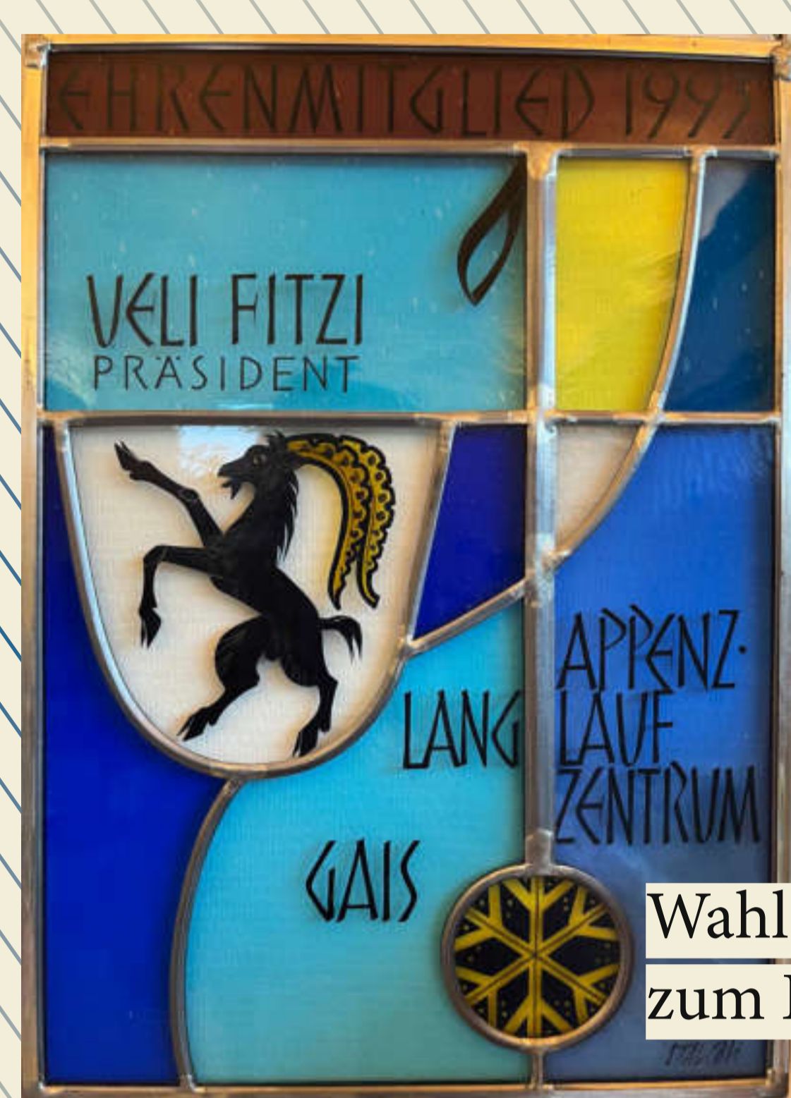
Wahl von Ueli Fitzi zum Ehrenmitglied