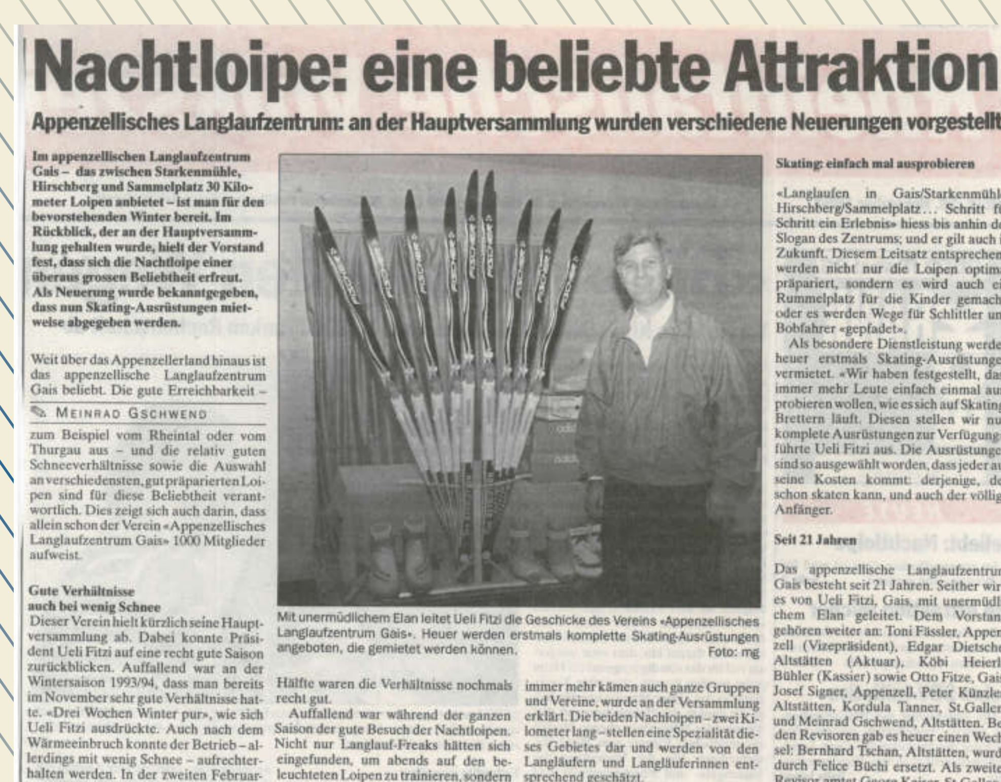
Erstmals können komplette Skating-Ausrüstungen gemietet werden